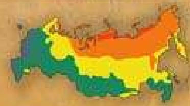
СТЕПЕНЬ БЛАГОПРИ- ЯТНОСТИ ПРИРОДНЫХ УСЛОВИЙ ЖИЗНИ НАСЕЛЕНИЯ