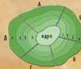
РАЙОНИРОВАНИЕ "СНИЗУ" (УЗЛОВОЕ)