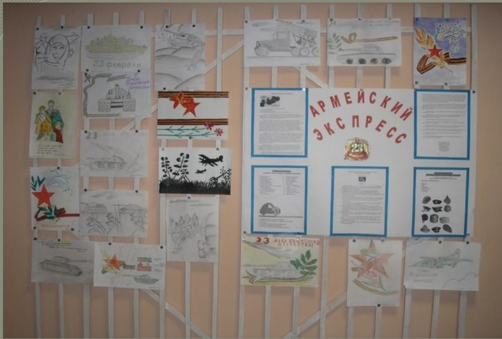
Выпуск стенгазеты «Армейский экспресс»